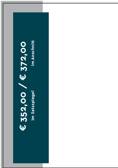
Format D — 1/3 Seite Format: 63 x 266,5 mm (B x H) Format D — 1/3 Seite Format: 70 x 297 mm (B x H) + 3 mm Beschnitt; Platzierung links oder rechts