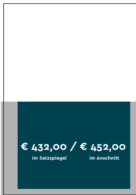
Format E im Satzspiegel — 1/2 Seite Format: 175 x 135 mm (B x H) Format E im Anschnitt — 1/2 Seite Format: 210 x 145 mm (B x H) + 3 mm Beschnitt; Platzierung links oder rechts