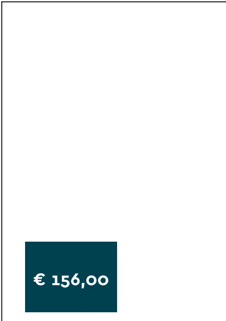
Format A — 1/8 Seite Format: 85 x 65 mm (B x H) Platzierung links oder rechts

Rabattgestaltung siehe Seite 4 — Preise zzgl. gesetzlicher MwSt.