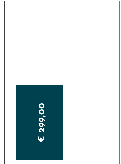
Format C — 1/4 Seite Format: 85 x 135 mm (B x H) Platzierung links oder rechts